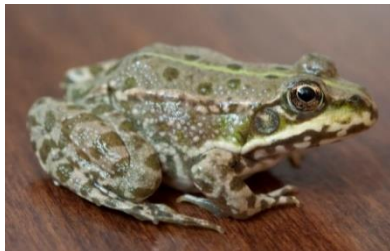
Mais de quelle espèce est cette grenouille ?

Alors que les gelées se font plus rares, les amphibiens refont leur apparition. Beaucoup quittent leur site d'hivernage pour rejoindre le site de reproduction en zones humides. Victimes de leurs prédateurs naturels (oiseaux, serpents, petits mammifères), les grenouilles, crapauds, tritons et salamandres doivent également affronter le parcours semé d'embûches que nous leur imposons (routes, clôtures). Leurs déplacements lents, après leur long sommeil hivernal, rendent la traversée des routes très périlleuse. Certains dispositifs temporaires (filets de capture sur le bord des routes au printemps et à l'automne) ou plus durables, comme les crapauducs (tunnels installés sous la chaussée permettant de la traverser), peuvent faciliter cette étape de leur parcours. Ces amis du jardinier qui limitent la prolifération des insectes piqueurs comme les moustiques méritent qu'on leur prête attention. Ouvrons l'œil !