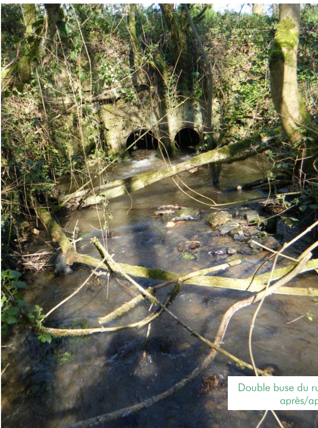
Double buse du ruisseau des Jinchères après/après travaux