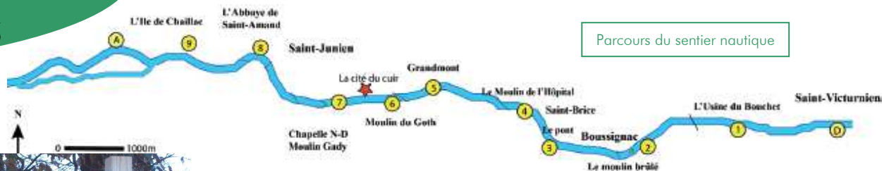
Parcours du sentier nautique