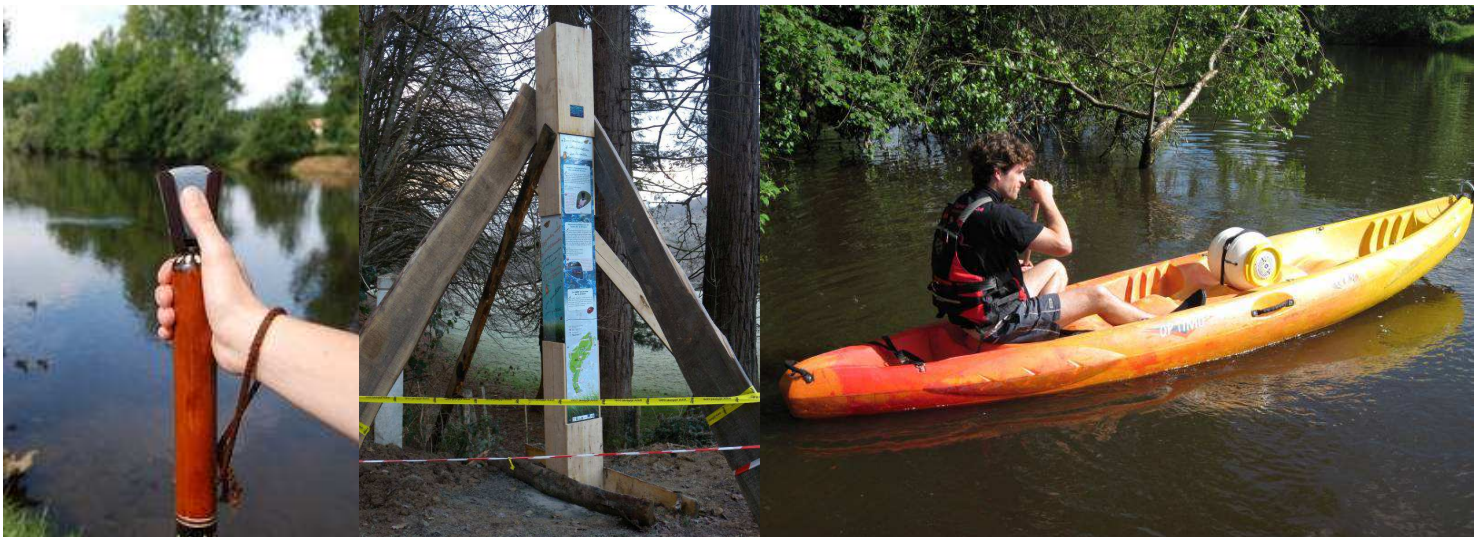
Le bâton de marche