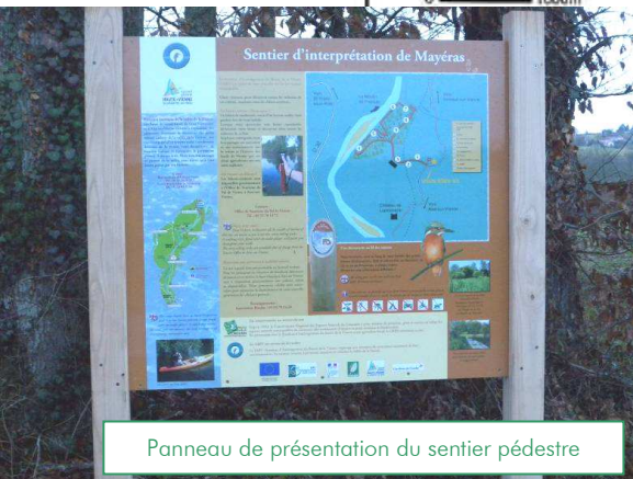
Panneau de présentation du sentier pédestre

Le projet fait suite à un programme ambitieux de franchissement des ouvrages de la Vienne par les kayaks. Maintenant que les passes et autres contournements sont fonctionnels, il restait à se consacrer à l'étape de la valorisation.