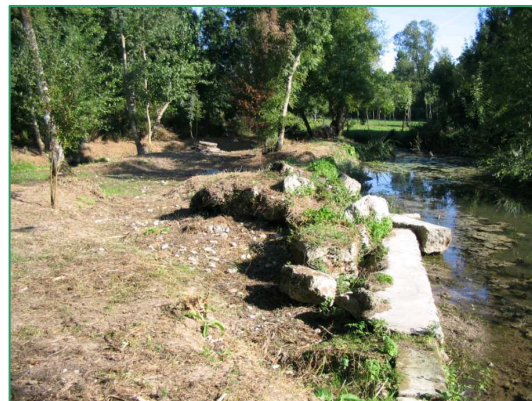
Vue générale en septembre 2005

Date des travaux : août et septembre 2008