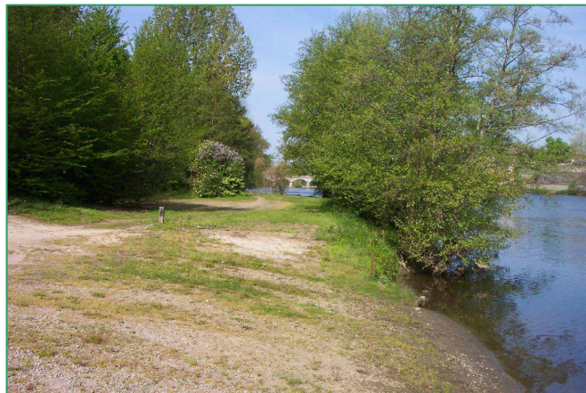
Saint-Victurnien avant aménagement

Cet aménagement permet de rétablir la libre circulation piscicole, d'autoriser le franchissement du barrage pour les pratiquants d'activités nautiques et d'organiser des manifestations ludiques et sportives autour du canoë-kayak.