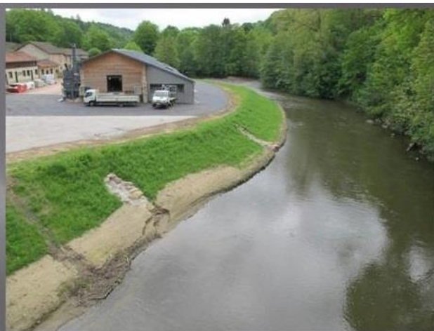
Vue d'ensemble après travaux