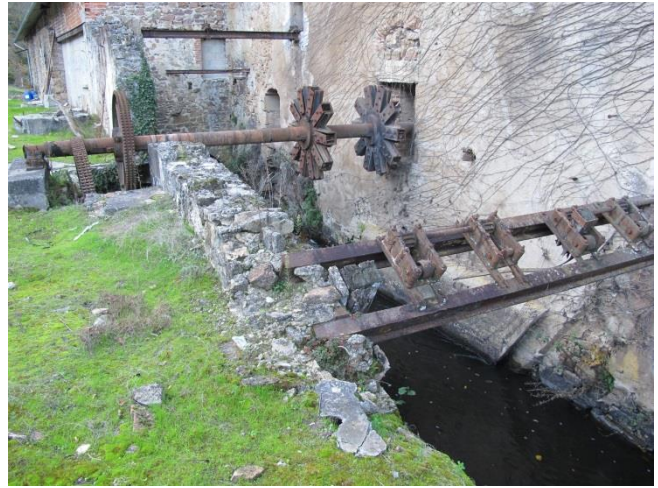
Bief du moulin avant travaux