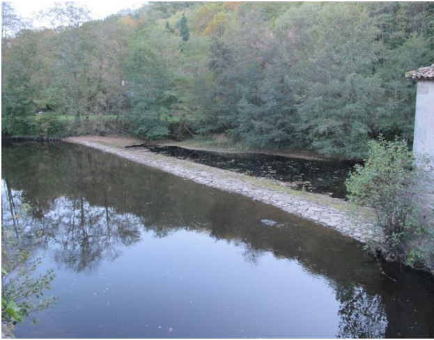
Seuil du moulin avant travaux