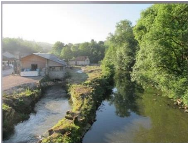
Vue d'ensemble avant travaux